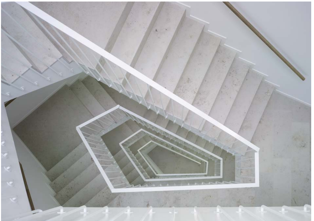
Bilder > Polygonförmige Treppe mit Oblicht