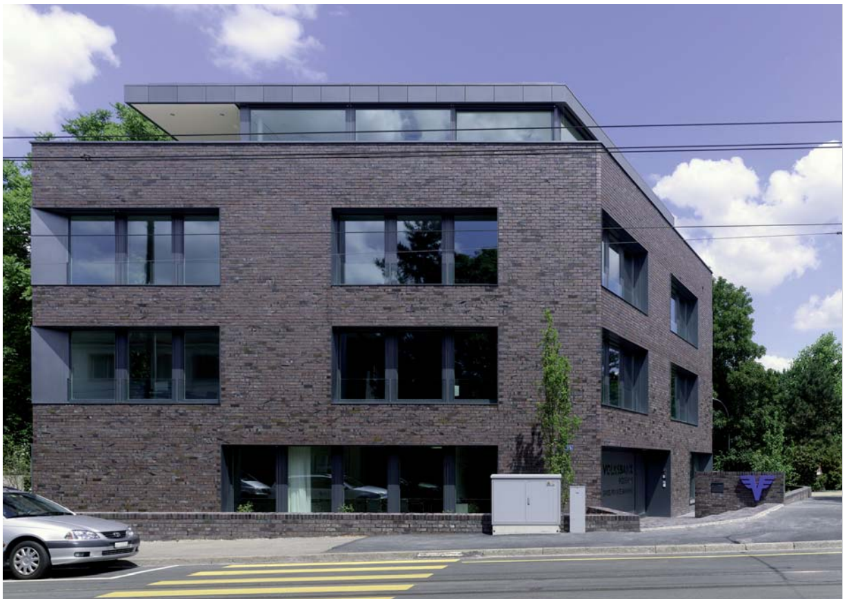
Bild oben > Fassade aus Klinkerstein Bild unten > Aussenansicht Adlerstrasse mit Haupteingang