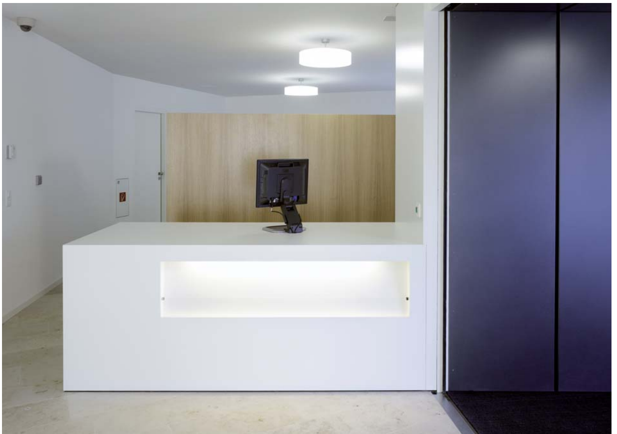
Bild oben > Wartebereich vor den Besprechungsräumen für Kunden Bild unten > Eingangsbereich mit Empfang