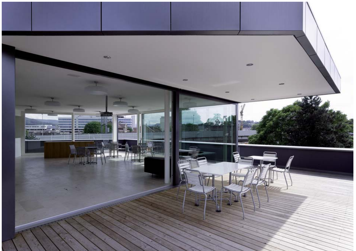
Bild oben > Polygonförmige Treppe mit Oblicht Bild unten > Dachterrasse für Kundenanlässe und Mitarbeiter